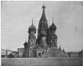
ÉGLISE SAINT-BASILE à MOSCOU (PRÈS DU KRÉMLIN) Cliché de M. R. D.