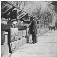
(Click) Instantané fait avec le Ball's-Eye, Kodak n° 2.

La femme, placée au milieu du groupe dans les portraits du document et celle de l'instantanée, avait bien le même genre de costume