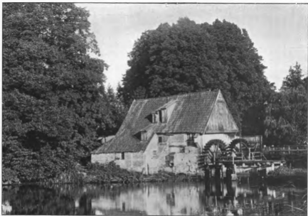
ÉTUDE DE MOULIN AU BORD DE L'EAU

Cliché fait avec l'Appareil Photosphère (de la Maison Conté, rue de Solferino)